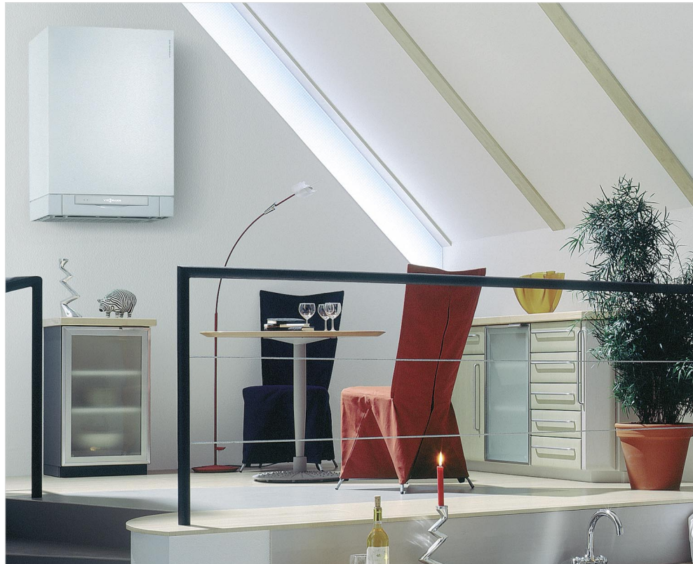
Kocioł wiszący Vitopend 222 dzięki nowoczesnemu wzornictwu może być elementem wyposażenia wnętrza.

Użytkownik nie musi wcale zajmować się regulatorem swojego kotła. Raz nastawiony przez instalatora, sam dba o pożądany komfort ogrzewania. Przystawianie z czasu letniego na zimowy i odwrotnie następuje automatycznie, program oszczędnościowy i wakacyjny uruchamia się jednym naciśnięciem przycisku. Jednym z przykładów korzystnej (pod względem ceny i funkcjonalności) konfiguracji automatyki kotła jest regulator stałotemperaturowy Vitotronic 100, współpracujący ze zdalnym sterowaniem w postaci termostatu Vitotrol 100. Termostat ten – poza nowoczesnym wzornictwem – posiada polskie menu tekstowe, co czyni „rozmowę” z nim łatwą i przyjemną.