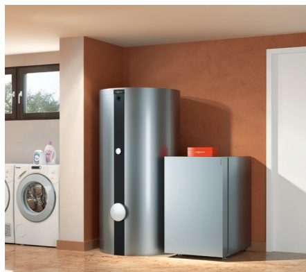
Kompaktowa pompa ciepła Vitocal 200-G to idealne rozwiązanie zarówno dla nowych jak i modernizowanych systemów grzewczych.

Zeskanuj kod i odwiedź naszą stronę internetową