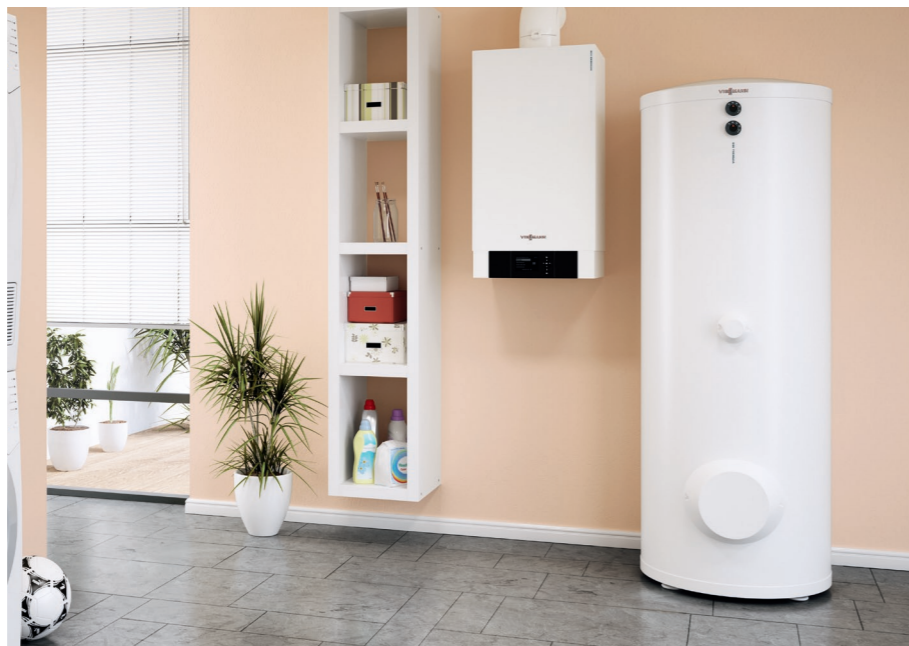
Szeroka gama podgrzewaczy c.w.u. Vitocell pozwala skompletować system grzewczy z kotłem kondensacyjnym Vitodens według indywidualnych potrzeb inwestora

W przypadku braku dostępu do sieci gazowej, coraz częściej wykorzystywane są