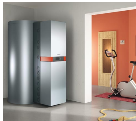
Gazowa, kondensacyjna centrala grzewcza do współpracy z kolektorami słonecznymi do podgrzewu ciepłej wody użytkowej i wspomagania ogrzewania