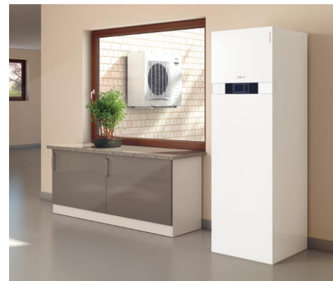
Najnowsza seria pomp ciepła powietrze-woda typu Split wykorzystuje ciepło w powietrzu na zewnątrz budynku stanowiąc alternatywę dla paliw kopalnych.

Nowoczesne kotły kondensacyjne są w wielu wypadkach trafny wybór. Tak dla budynków istniejących, jak i nowobudowanych, jednorodzinnych i wielorodzinnych: ta szczególnie efektywna technika zamienia w ciepło nawet 98% energii, zawartej w gazie lub oleju opalowym dzięki wykorzystaniu ciepła kondensacji – zawartego w parze wodnej powstającej przy spalaniu – w ten sposób, nawet przy rosnących cenach, można ekonomicznie ogrzewać budynek. Stosowane rozwiązania, takie jak powierzchnie grzewcze InoX-Radial ze stali kwasoodpornej z dodatkiem tytanu i molibdenu czy palniki promiennikowe MatriX, nie mają odpowiedników na rynku techniki grzewczej. Inwestycja w urządzenie kondensacyjne splota się już po pięciu – siedmiu latach. Kotły kondensacyjne są – przy uwzględnieniu kosztów zakupu i montażu – rozwiązaniem zdecydowanie najkorzystniejszym.