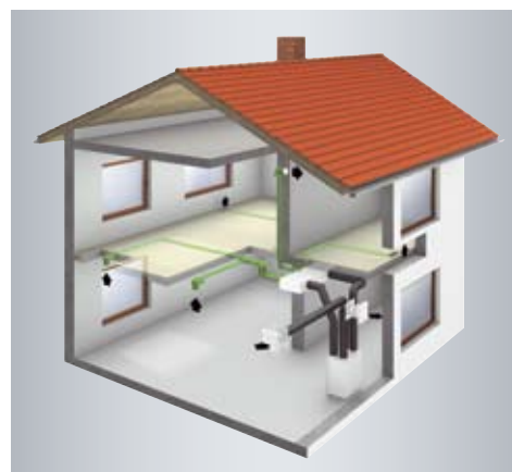
System wentylacji mieszkania Vitovent 300 z odzyskiem ciepła i podgrzewaniem powietrza zapewnia w lecie i w zimie komfortowy klimat w pomieszczeniach.