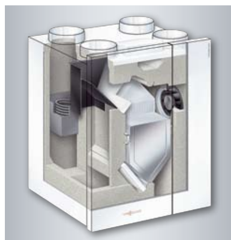
Schemat budowy urządzenia systemu wentylacji mechanicznej z odzyskiem ciepła Vitovent 300-W

Dzięki ciągłej wymianie powietrza przez Vitovent 300 i Vitovent 300-W okna trzeba otwierać co najwyżej do ich umycia. Chroni to nie tylko lepiej przed włamywaczami, ale i nie dopuszcza do wnętrza hałasów ulicznych.