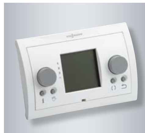
Moduł zdalnej obsługi Vitovent 300-W umożliwia komfortowe obsługiwanie systemu wentylacji z dowolnego pomieszczenia.

Jeżeli przewidzimy zastosowanie wentylacji mechanicznej z odzyskiem ciepła już na etapie projektu budowlanego domu czy też mieszkania, może się okazać, iż koszty inwestycyjne takiego systemu będą równe, a może nawet niższe od instalacji wentylacji grawitacyjnej. Spowodowane to jest faktem, że wykonanie systemu wentylacji grawitacyjnej wiąże się z kosztami wykonania mурowanych kominów oraz złożonej konstrukcji dachu, a także zamontowaniem nawiewników higrosterowanych i moskitier w oknach.