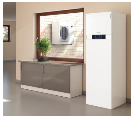
Najnowsza seria pomp ciepła powietrze-woda typu Split wykorzystuje ciepło w powietrzu na zewnątrz budynku stanowiąc alternatywę dla paliw kopalnych.

Nowoczesne kotły kondensacyjne są w wielu wypadkach trafnym wyborem. Tak dla budynków istniejących, jak i nowobudowanych, jednorodzinnych i wielorodzinnych: ta szczególnie efektywna technika zamienia w ciepło nawet 98% energii, zawartej w gazie lub oleju opałowym dzięki wykorzystaniu ciepła kondensacji – zawartego w parze wodnej powstającej przy spalaniu – w ten sposób, nawet przy rosnących cenach, można ekonomicznie ogrzewać budynek. Stosowane rozwiązania, takie jak powierzchnie grzewcze InoX-Radial ze stali kwasoodpornej z dodatkiem tytanu i molibdenu czy palniki promiennikowe MatriX, nie mają odpowiedników na rynku techniki grzewczej. Inwestycja w urządzenie kondensacyjne spłaca się już po pięciu – siedmiu latach. Kotły kondensacyjne są – przy uwzględnieniu kosztów zakupu i montażu – rozwiązaniem zdecydowanie najkorzystniejszym.