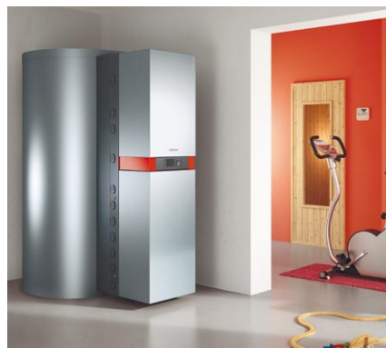
Gazowa, kondensacyjna centrala grzewcza do współpracy z kolektorami słonecznymi do podgrzewu ciepłej wody użytkowej i wspomagania ogrzewania