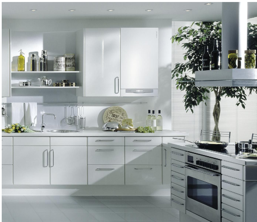
Nowe wzornictwo kotłów wiszących firmy Viessmann doskonale komponuje się w niemal każdym wnętrzu

To, co najbardziej zdumiewa w tych na wskroś nowoczesnych urządzeniach, to ich niezwykle design. Prostota formy uwydatnia przejrzystość struktur, a kolorystyka utrzymana w bieli uszlachetnionej mieniącym się metalicznym pigmentem (vito-biały)