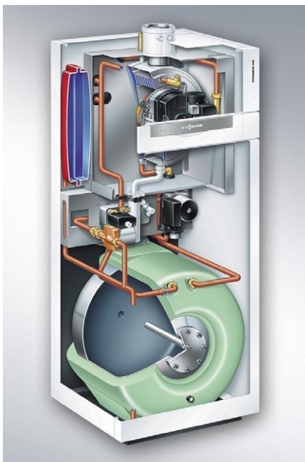
Przekrój schematyczny nowego kotła kondensacyjnego Vitodens 333 z wbudowanym zasobnikiem c.w.u. o pojemności 86 litrów

Niskoszumowy palnik gazowy MatriX-compact i regulowana elektronicznie pompa o zredukowanych szumach przepływu gwarantują cichą pracę kotła. Vitodens 300 wyposażony jest w automatyczną adaptację układu spalin. Podczas pracy kotła dopasowuje ona w sposób ciągły warunki