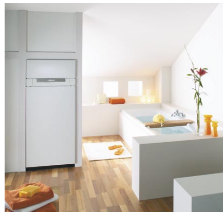
Kocioł Vitodens 333 w zabudowie łazienkowej

Vitopend 100 to kocioł jedno- lub dwufunkcyjny o znamionowej mocy cieplnej modulowanej od 10,5 do 24 kW, wyróżnia się wysoką sprawnością znormalizowaną do 92%. Jego istotnymi cechami są kompaktowe wymiary oraz energooszczędność. Palnik ze zmieszanym wstępnym zastosowany w kotle jest szczególnie oszczędny, gdyż dzięki modulowanemu systemowi pracy dopasowuje się do zapotrzebowania na ciepło. Emisje substancji szkodliwych są zdecydowanie niższe od dopuszczalnych wartości granicznych.