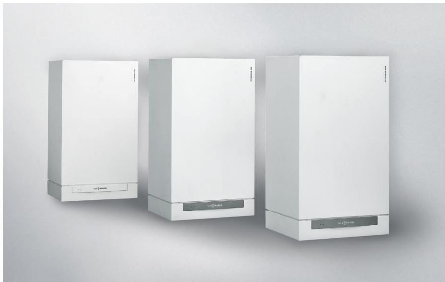
Nowe wzornictwo kotłów wiszących jest połączeniem techniki, formy i funkcjonalności z nierozzerwalnymi cechami marki Viessmann: jakością, trwałością i komfortem.

Adresy i numery telefonów lokalnych Doradców i Przedstawicieli Handlowych znajdą Państwo na naszej stronie internetowej: www.viessmann.pl