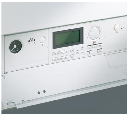
Vitotronic 200 z nowej serii regulatorów dla kotłów wiszących

dowane są modułowo, zapewniając wysoki stopień unifikacji komponentów. System połączeń wtykowych Multi-Steck, płyta wodna Aqua-Platine oraz dobry dostęp do najważniejszych części, oszczędza czas przy konserwacji i serwisowaniu.