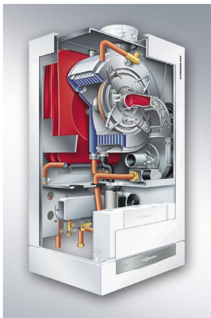
Przekrój schematyczny nowego kotła kondensacyjnego Vitodens 200

doskonale wpasowuje się we wnętrze. Integrację ułatwiają także kompaktowe wymiary – odpowiadają one bowiem powszechnie stosowanemu modułom mebli kuchennych.