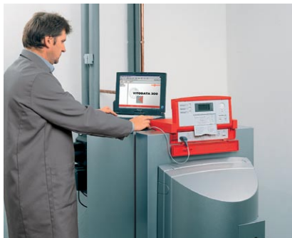
Pomoc techniczna w miejscu montażu urządzenia.

Kolejność tematów została uporządkowana w chronologii najczęściej stawianych pytań w okresie rozpoczynającym sezon grzewczy.