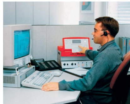
Pomoc telefoniczna w przypadku prostych problemów serwisowych.