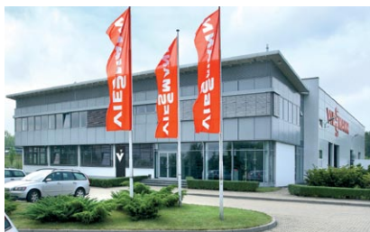
Centrum Nowoczesnej Techniki Grzewczej w Mysłowicach.

Działalność infolinii jest skierowana do użytkowników urządzeń grzewczych firmy Viessmann, instalatorów jak również do firm serwisowych. Infolinia jest usługą ogólnodostępną więc każda osoba dzwoniąca uzyska niezbędną, szybką fachową pomoc. Nawet użytkownicy produktów innych marek w miarę możliwości uzyskają niezbędne obiektywne informacje.