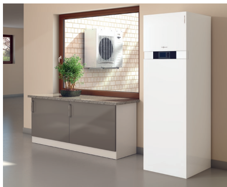
Najnowsza seria pomp ciepła powietrze-woda typu Split wykorzystuje ciepło w powietrzu na zewnątrz budynku stanowiąc alternatywę dla paliw kopalnych.

Najczęściej sercem układu jest kocioł. Firma Viessmann może zaproponować szeroki wybór kondensacyjnych gazowych kotłów wiszących. Począwszy od dostępnych dla każdego kotłów Vitodens 100-W, a skończywszy na najbardziej zaawansowanych technicznie kotłach Vitodens 300-W. Na bazie kotłów Vitodens 200-W i Vitodens 300-W proponujemy klientom kompaktowe centrale grzewcze takie jak Vitodens 222-F i Vitodens 333-F a także dedykowany instalacjom solarnym Vitodens 343-F. Urządzenia te łączą w jednej, stojącej obudowie kompletny gazowy kocioł kondensacyjny i zbiornik na ciepłą wodę użytkową. Wymienione urządzenia popularnie zwane „lodówkami” mają bardzo estetycznie wykonane obudowy, mogą więc być ustawiane np. w kuchni czy łazience idealnie komponując się z pozostałymi meblami. Wymienione kotły kondensacyjne posiadają automatykę opartą o najnowsze regulatory pogodowe Vitotronic 200 lub stałotemperaturowe Vitotronic 100. Automatyka ma istotną funkcję obsługi do trzech obiegów grzewczych. Jeden obieg bezpośredni i dwa obiegi za układami mieszającymi. Oznacza to możliwość zbudowania instalacji grzewczej, w której jeden obieg będzie ogrzewał np. sypialnie poprzez bezpośredni obieg grzejnikowy, pierwszy obieg za układem mieszającym - podłogówkę w części gościnnej i drugi obieg „mieszaczowy” ogrzewający