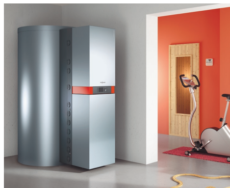
Gazowa, kondensacyjna centrala grzewcza do współpracy z kolektorami słonecznymi do podgrzewu ciepłej wody użytkowej i wspomagania ogrzewania

Trudno w jednym artykule wymienić wszystko co oferuje firma Viessmann. Klient może zakupić kompletne systemy począwszy od kotła, poprzez zasobnik, przewody, pompy, zawory mieszające wraz z elektroniką sterującą i silnikami, skończywszy na grzejnikach z głowicami termostatycznymi lub ogrzewaniu podłogowym. Chcąc regulować pracą układu użytkownik nie będzie musiał wchodzić do kotłowni. Wszystkie potrzebne nastawy może wykonać np. z pokoju korzystając z regulatorów z serii Vitotrol. A gdyby zaszła potrzeba włączenia lub wyłączenia kotła zdalnie można to zrealizować dzięki modułowi Vitocom 100 GSM, który steruje pracą kotła lub pompy ciepła odbierając od właściciela polecenia przesłane w wiadomości tekstowej SMS.