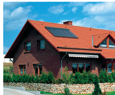
Kolektory słoneczne o wysokiej wydajności to idealne rozwiązanie do podgrzewania ciepłej wody użytkowej i wspomagania ogrzewania budynku.