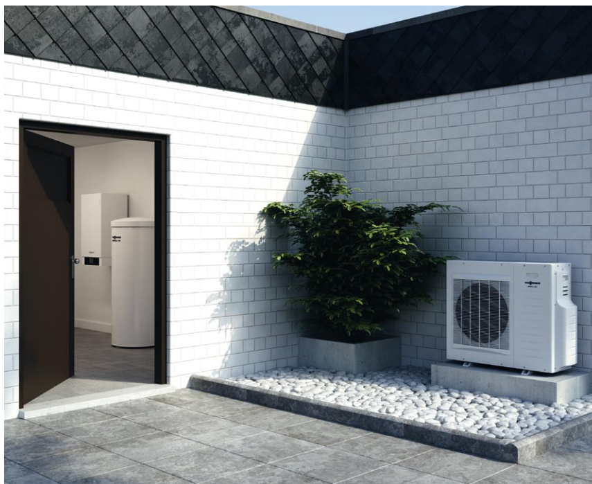
Pompa ciepła Vitocal 200-S ekonomicznie wykorzystuje ciepło z otaczającego nas powietrza.

Przy modernizacji ogrzewania pompa ciepła w układzie „split” nadaje się doskonale do efektywnej pracy biwalentnej, współpracując z istniejącą instalacją grzewczą, pokrywającą w większej części zapotrzebowania na ciepło.