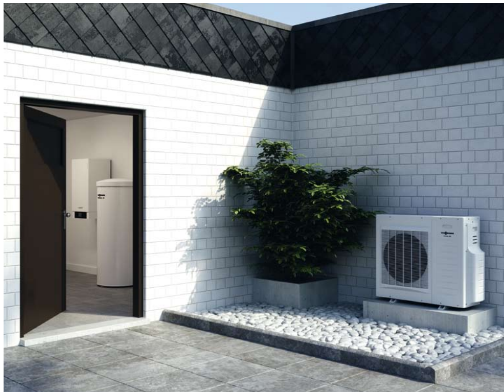
Pompa ciepła Vitocal 200-S ekonomicznie wykorzystuje ciepło z otaczającego nas powietrza.

Przy modernizacji ogrzewania pompa ciepła w układzie „split” nadaje się doskonale do efektywnej pracy biwalentnej, współpracując z istniejącym źródłem ciepła wspomagającą pompę ciepła w mroźne dni.