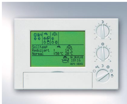
Nowy regulator pompy ciepła z systemem komunikacji i zdalnym monitoringiem umożliwia podłączenie do Vitocom 100

Szczegóły oferty dotyczącej nowoczesnych systemów grzewczych i urządzeń wykorzystujących odnawialne źródła energii znajdują Państwo na stronie internetowej www.viessmann.pl oraz u naszych Partnerów i Doradców Handlowych.