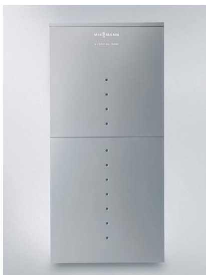
Pompa ciepła Vitocal 300-A może być zainstalowana na zewnątrz lub wewnątrz budynku.

Pompa Vitocal 300-A jest dostarczana w zależności od wersji w komplecie z pełnym wyposażeniem. Oznacza to, że pompy, naczynie wyrównawcze oraz komponenty bezpieczeństwa są już zamontowane fabrycznie. W zależności od potrzeby można w łatwy sposób podłączyć elektryczny podgrzewacz wody grzewczej. Pompa Vitocal 300-A może być ustawiana wewnątrz i na zewnątrz budynków. Służy do tego odpowiednio dostosowany zestaw akcesoriów i osprzętu.