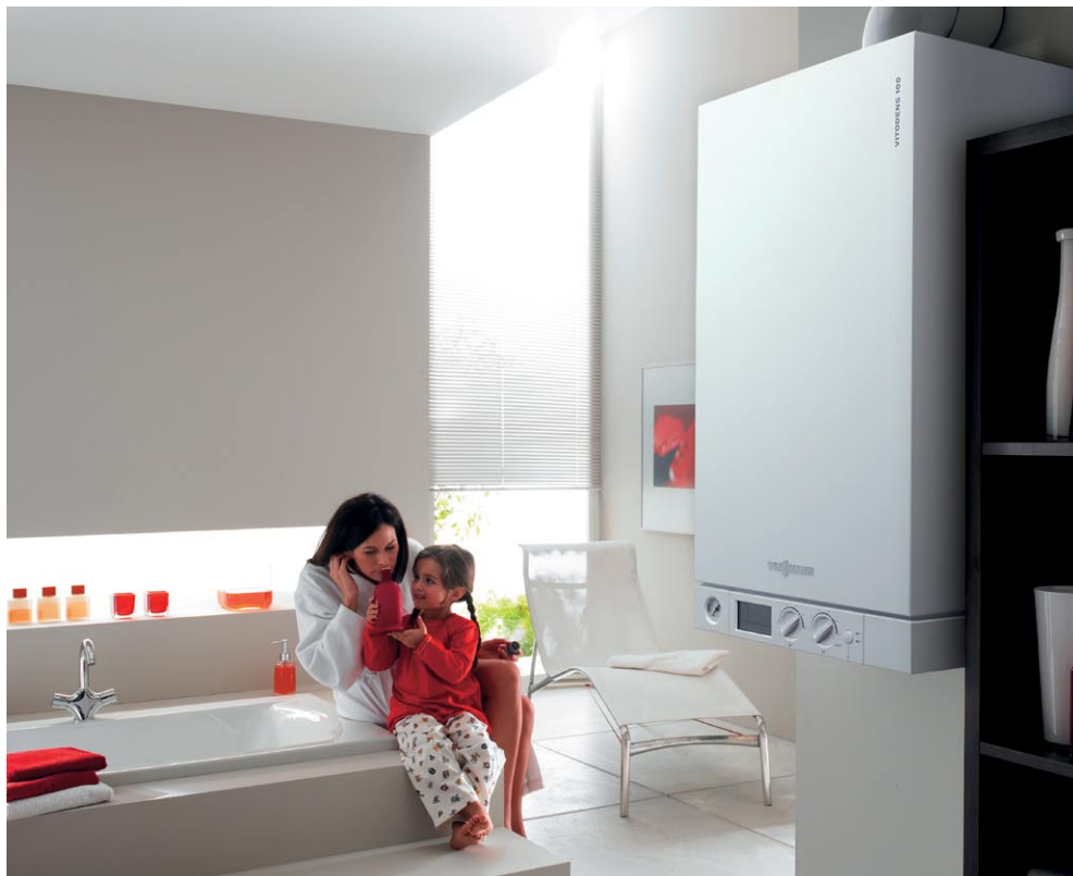
Nowoczesne i funkcjonalne wzornictwo sprawia, że kocioł Vitodens 100-W stanowi element ozdobny, pasujący do każdego pomieszczenia.