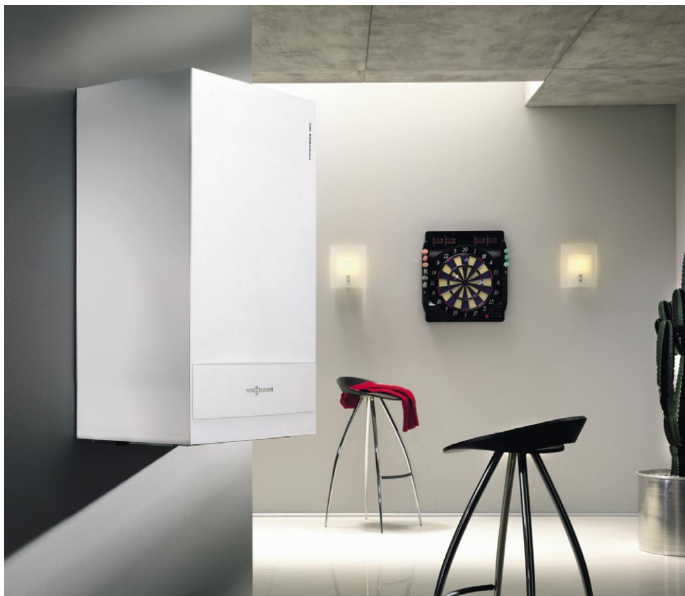
Gazowy kocioł wiszący Vitodens 100-W pasuje doskonale do każdej aranżacji.