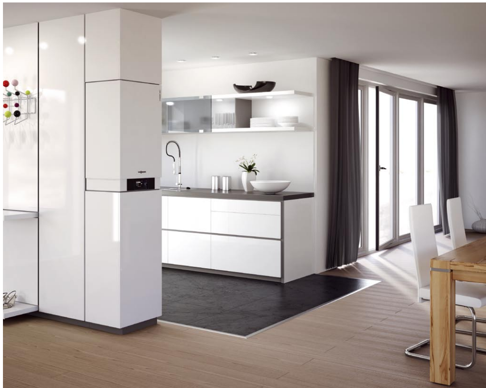
Wiszące gazowe kotły kondensacyjne marki Viessmann wyróżniają się nowym, funkcjonalnym wzornictwem.

Fachowy instalator szybko zainstaluje i uruchomi kocioł Vitodens 200-W – zarówno przy nowej instalacji jak i przy wymianie starego kotła.