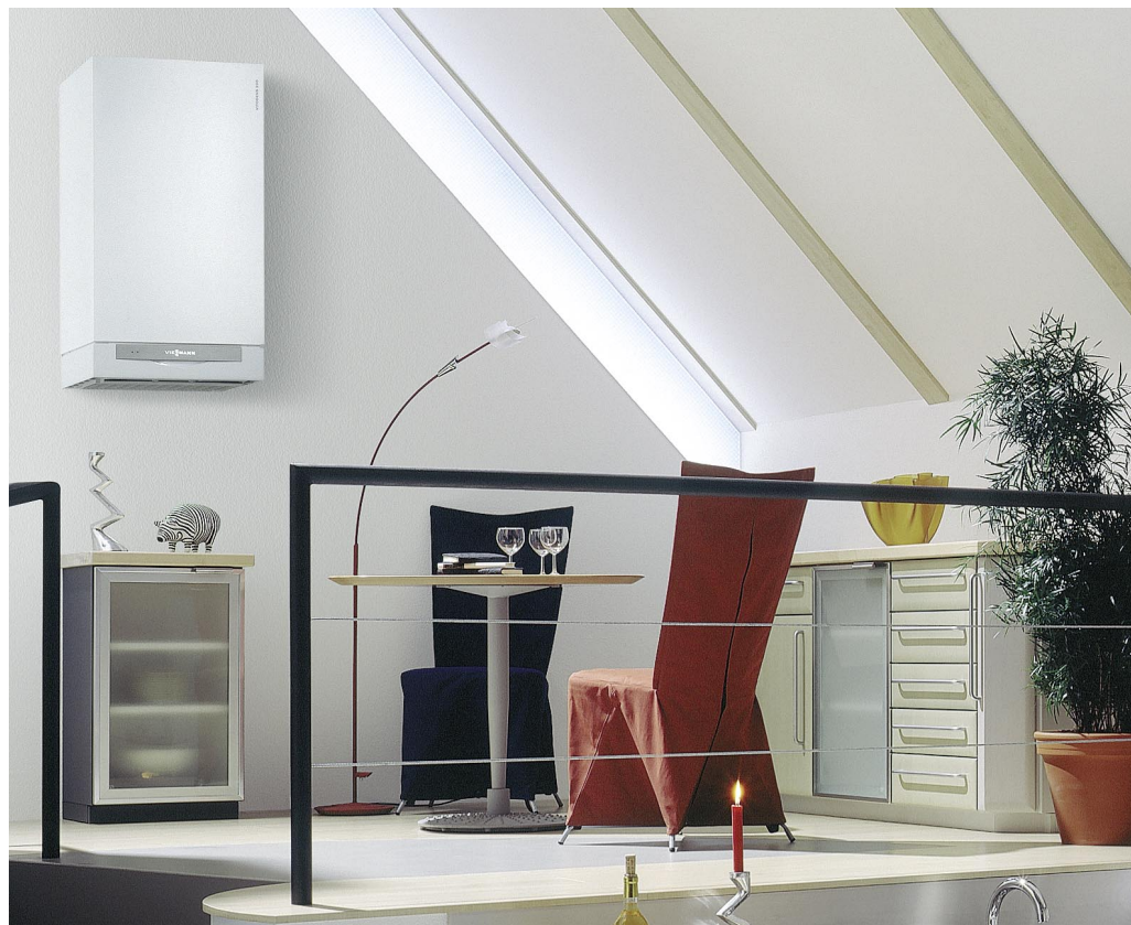
Kocioł wiszący Vitodens 200-W dzięki nowoczesnemu wzornictwu może być elementem wyposażenia wnętrza