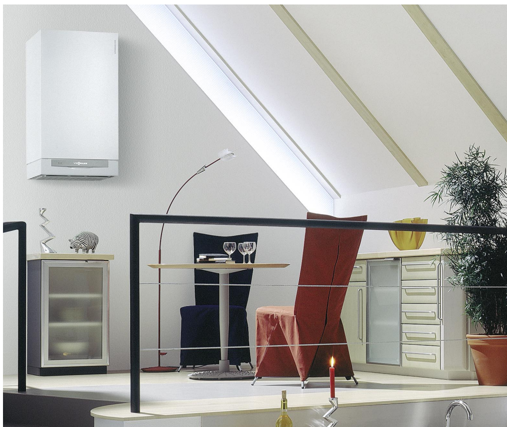
Kocioł wiszący Vitodens 200-W umożliwia perfekcyjną integrację urządzenia ze ścianą.