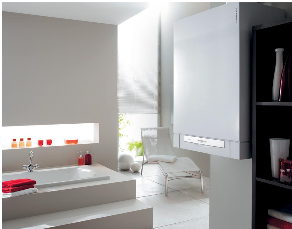
Nowoczesne i funkcjonalne wzornictwo sprawia, że kocioł Vitodens 222-W stanowi element ozdobny, pasujący do każdego pomieszczenia.