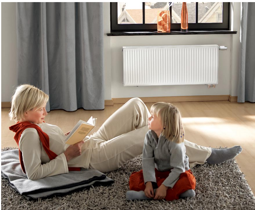
Grzejniki uniwersalne firmy Viessmann o wysokiej wydajności cieplnej i neutralnym wyglądzie nadają się równie dobrze do pomieszczeń mieszkalnych, jak i biurowych.

Estetyczne, proste formy i biały kolor grzejników idealnie wkomponują się w naszych wnętrzach. Grzejniki Viessmann można instalować zarówno