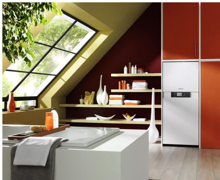
Kondensacyjny kocioł kompaktowy to połączenie zalet kotła jednofunkcyjnego z wysokim komfortem ciepłej wody oraz oddzielnego zasobnika z ciepłą wodą użytkową.