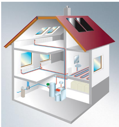
W ofercie firmy Viessmann znajdują się wszystkie elementy do budowy instalacji grzewczej

Zapraszamy Państwa na naszą stronę internetową www.viessmann.pl gdzie możecie Państwo złożyć zapytanie ofertowe. Odpowiedzią na zapytanie będzie porada techniczna naszego doradcy wraz z kompleksową ofertą cenową.