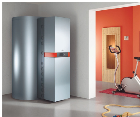
Gazowa, kondensacyjna centrala grzewcza do współpracy z kolektorami słonecznymi do podgrzewu ciepłej wody użytkowej i wspomagania ogrzewania