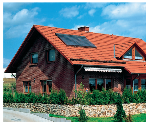
Płaskie kolektory słoneczne o wysokiej wydajności to idealne rozwiązanie do podgrzewania ciepłej wody użytkowej i wspomagania ogrzewania budynku.

W energiach odnawialnych największy, bo 70 procentowy udział ma biomasa i są ku temu dobre powody: drewna opałowego i peletu nie trzeba na przykład importować, są one dostępne przez cały rok, łatwo można je składować i spalać się z neutralnym bilansem CO 2 . W odróżnieniu od pieców kaflowych i kominków, odgrywających pierwszoplanowo funkcje dekoracyjne, nowoczesne kotły biomasowe przystosowane są do pracy w systemach centralnego ogrzewania i podgrzewu ciepłej wody w budynkach. Ilość wytwarzanego przez nie ciepła dopasowana jest do aktualnego zapotrzebo-