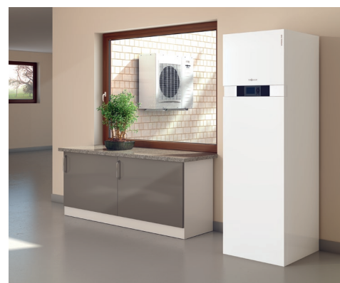
Najnowsza seria pomp ciepła powietrze-woda typu Split wykorzystuje ciepło w powietrzu na zewnątrz budynku stanowiąc alternatywę dla paliw kopalnych

Nowoczesne kotły kondensacyjne są w wielu wypadkach trafnym wyborem. Tak dla budynków istniejących, jak i nowobudowanych, jednorodzinnych i wielorodzinnych: ta szczególnie efektywna technika zamienia w ciepło nawet 98% energii, zawartej w gazie lub oleju opałowym dzięki wykorzystaniu ciepła kondensacji – zawartej w parze wodnej powstającej przy spalaniu – w ten sposób, nawet przy rosnących cenach, można ekonomicznie ogrzewać budynek. Stosowane rozwiązania, takie jak powierzchnie grzewcze InoX-Radial ze stali kwasoodpornej z dodatkiem tytanu i molibdenu czy palniki promiennikowe MatriX, nie mają odpowiedników na rynku techniki grzewczej. Inwestycja w urządzenie kondensacyjne spłaca się już po pięciu – siedmiu latach. Kotły kondensacyjne są – przy uwzględnieniu kosztów zakupu i montażu – rozwiązaniem zdecydowanie najkorzystniejszym.