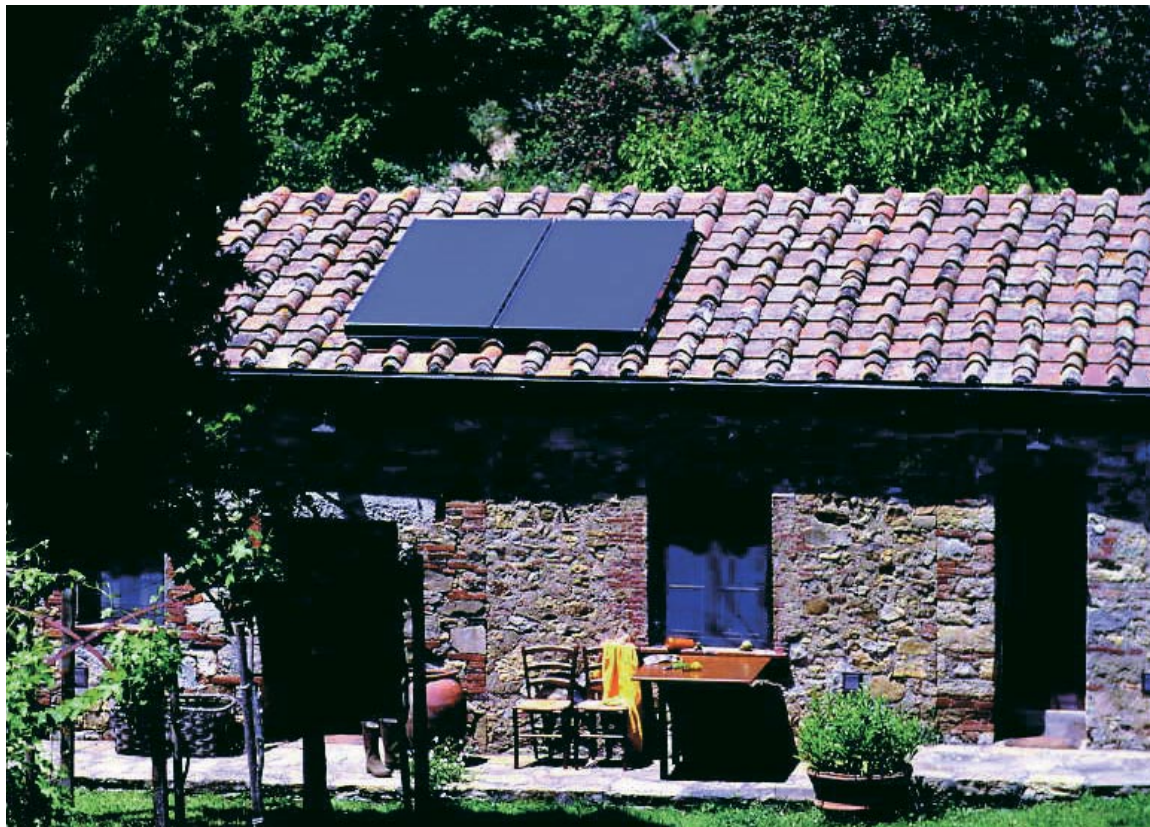
Nowy, wydajny i atrakcyjny cenowo kolektor płaski firmy Viessmann zapewnia trwałe oszczędności w kosztach eksploatacji.

Powierzchnia absorbera 2,3 m 2 pozwala na optymalnie dopasowanie wielkości pola kolektorów płaskich Vitosol 100-F do istniejącego zapotrzebowania na energię. Kolektory łączy się szybko, łatwo i bezpiecznie elastycznymi rurkami połączeniowymi ze stali szlachetnej.