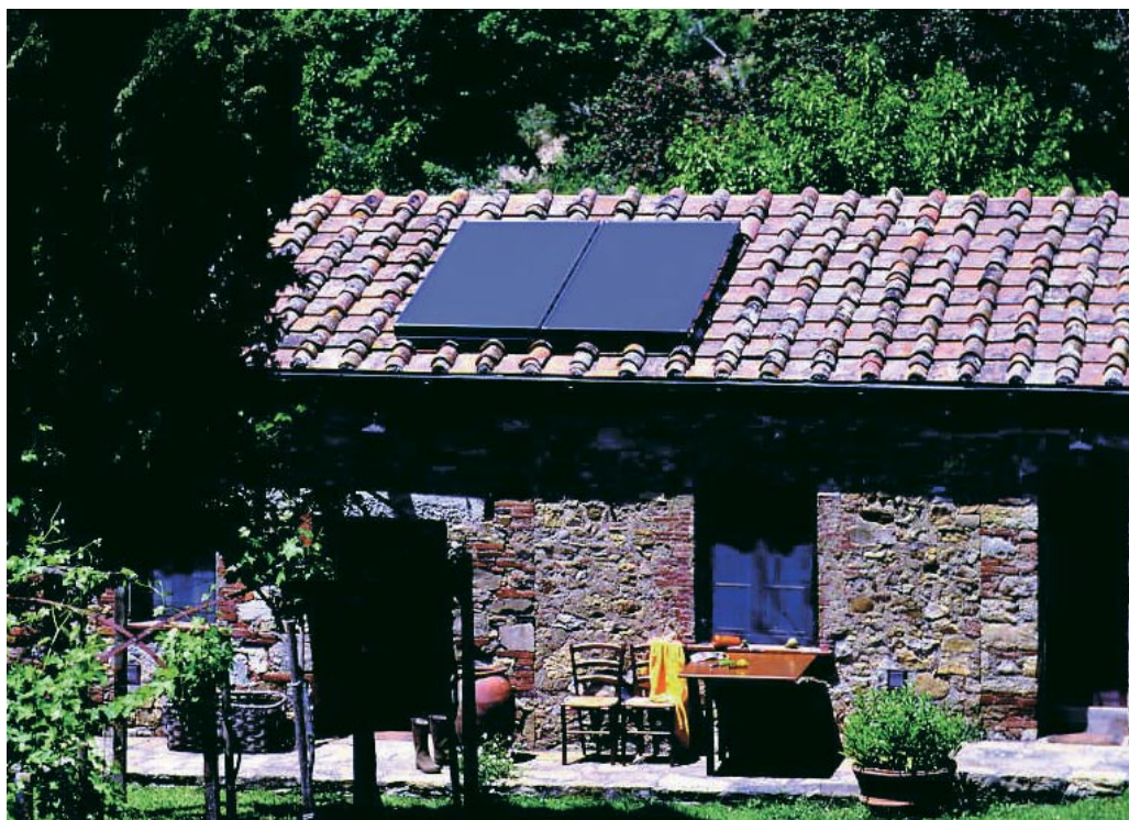
Nowy, wydajny i atrakcyjny cenowo kolektor płaski firmy Viessmann zapewnia trwałą oszczędności w kosztach eksploatacji.

Powierzchnia absorbera 2,3 m 2 pozwala na optymalnie dopasowanie wielkości pola kolektorów płaskich Vitosol 100-F do istniejącego zapotrzebowania na energię. Kolektory łączą się szybko, łatwo i bezpiecznie elastycznymi rurkami połączeniowymi ze stali szlachetnej.