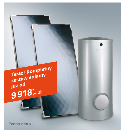
Podstawowy zestaw dwóch kolektorów słonecznych i podgrzewacza biwalentnego służący do modernizacji istniejącej instalacji grzewczej.

Program Vitosol firmy Viessmann oferuje kolektory słoneczne na każdą potrzebę i dla każdego „portfela” – od kolektorów płaskich, poprzez próżniowe kolektory rurowe, a także podgrzewacze biwalentne pozwalające współpracować instalacji solarnej z innym źródłem ciepła (np. kocioł gazowy/olejowy, pompa ciepła czy kocioł na drewno). Zależnie od życzenia, kolektory można montować zarówno na dachu, jak i na elewacji budynku. Mogą więc one stanowić istotny element architektury obiektów.