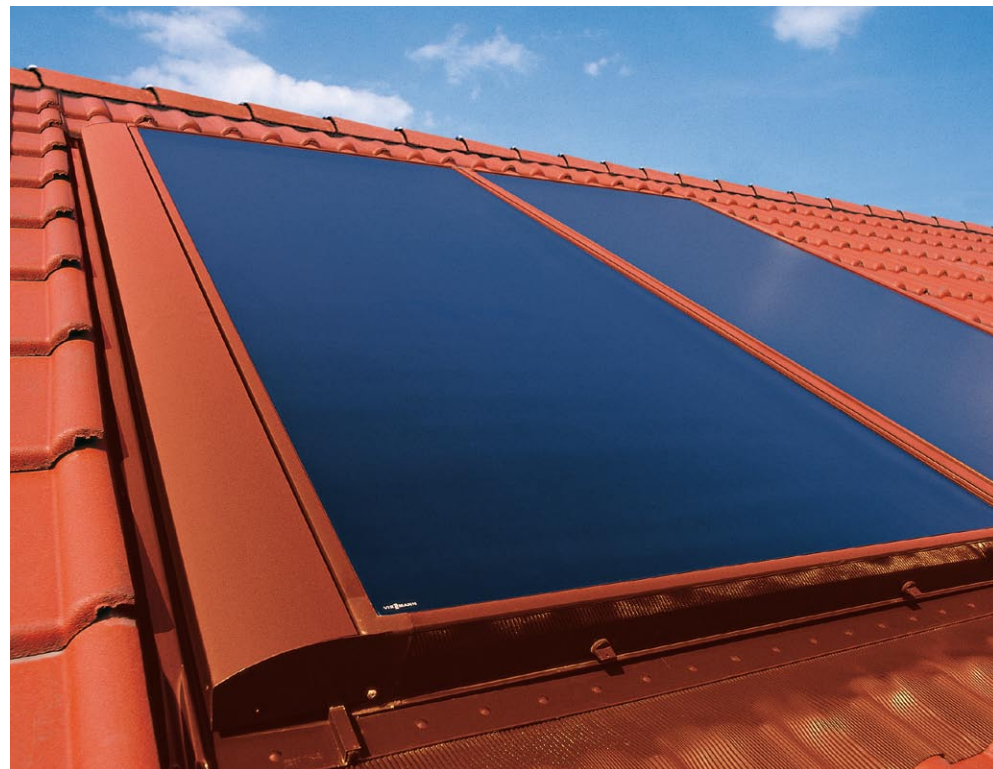
Atrakcyjne wzornictwo – obudowa kolektora może być na życzenie dostarczana w dowolnym kolorze z palety RAL.